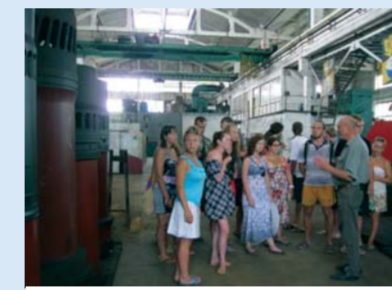
Посещение судоремонтного завода в Туапсе.

Факультет географии – один из самых интересных в Герценовском университете. Основным его достоинством я считаю возможность выезжать на полевые практики. Это не только шанс применить полученные во время учёбы знания, но и посетить уникальные уголки нашей огромной страны.