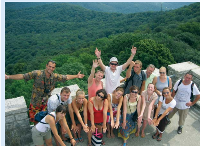
На горе Ахун в Сочи.