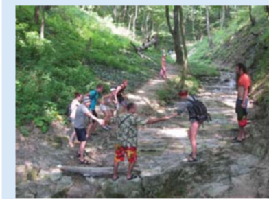
Изучение высотной поясности Малого Кавказа.