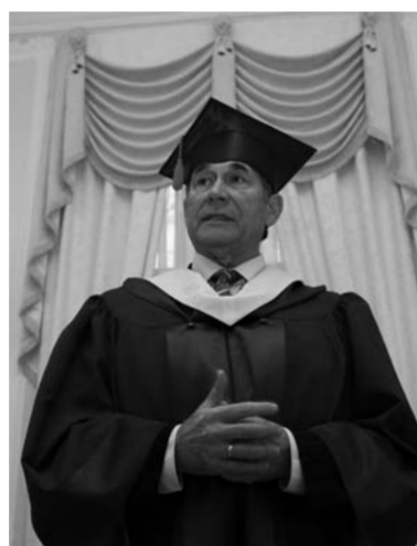
Ректор Г.А. Бордовский.