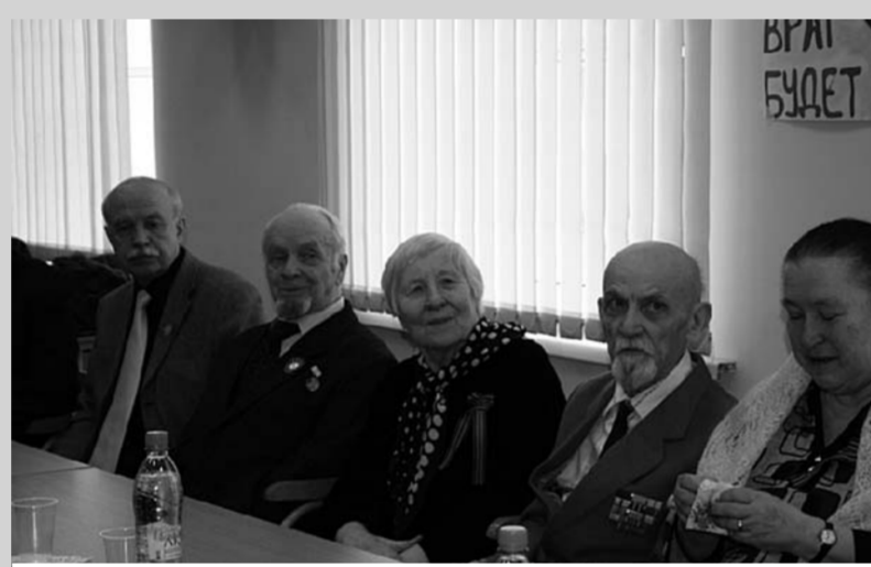
«Встреча студентов психолого-педагогического факультета РГПУ им. А.И. Герцена с ветеранами Великой Отечественной Войны, посвященная 65-летию Победы».

Для меня особенно был интересен момент, когда студентам задавали вопрос: «А что сподвигло вас принять участие в организации встречи?» Когда звучали ответы: «У меня бабушка воевала...» или «У меня бабушка жила в блокадном Ленинграде...», было видно, насколько сильно эти студенты связаны духовно со своими прародителями, насколько сильно они скорбят из-за того, что ветераны всё чаще и чаще уходят из этого мира, насколько сильно ценят то, что ветераны для нас сделали.