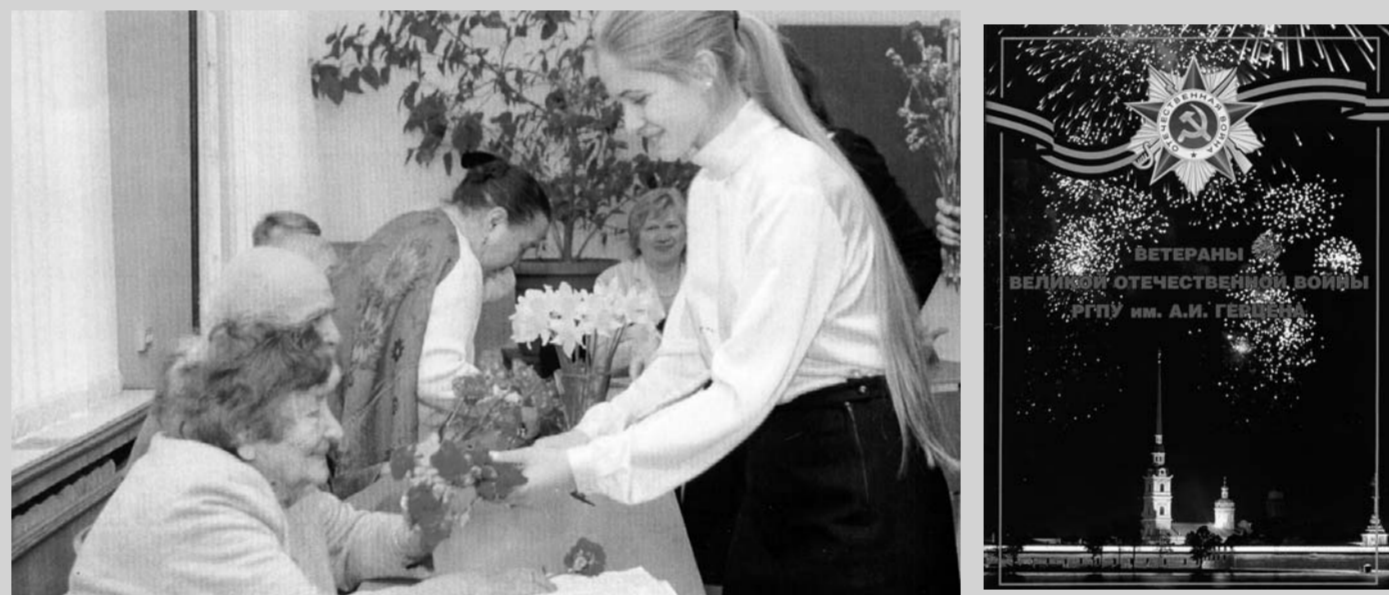
Встреча студентов психолого-педагогического факультета РГПУ им. А.И. Герцена с ветеранами Великой Отечественной Войны в 2007 году.

одной стороны, и очень тяжело, а с другой – радостно оттого, что мы смогли с ними поговорить. Я очень благодарна этим мужественным людям. Все эмоции очень сложно передать словами, но в душе остаётся чувство искренней благодарности.