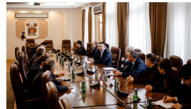
Переговоры с руководством города Ниш и представителями Нишского университета

– Сегодня в мэрии Ниша состоялась встреча, посвященная открытию Центра открытого образования и обучения на русском языке. Какие проблемы обсуждались?