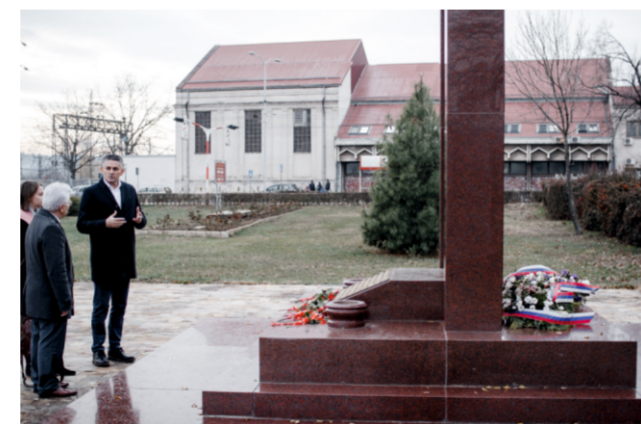
Петербургская делегация и заместитель мэра города Ниш Милош Банджур у мемориала солдатам-освободителям