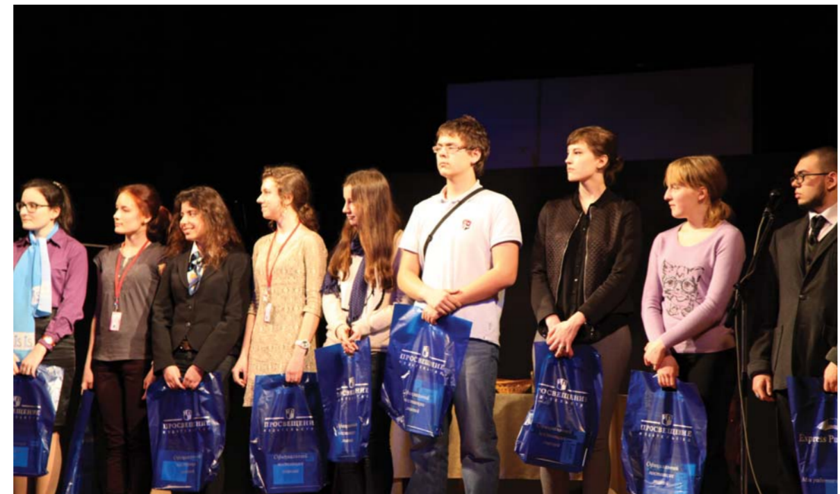
© И. Козлова / И. Козлова