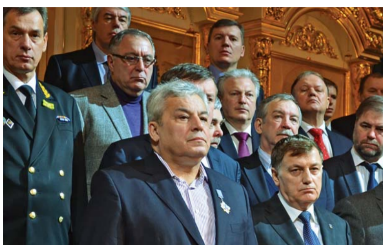
На торжественном молебье в Смольном соборе

НА ФАКУЛЬТЕТЕ ИЗОБРАЗИТЕЛЬНОГО ИСКУССТВА ГЕРЦЕНОВСКОГО УНИВЕРСИТЕТА ОТКРЫЛАСЬ ВЫСТАВКА «ТАТЬЯНИН ДЕНЬ», А ТАКЖЕ СОСТОЯЛОСЬ НАГРАЖДЕНИЕ ПОЧЕТНЫМ ЗНАКОМ СВЯТОЙ ТАТЬЯНЫ