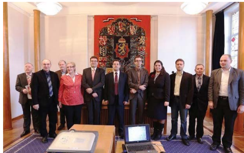
Участники Международной школы предпринимательства