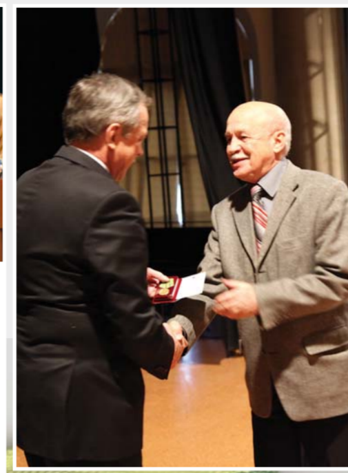
Торжественное награждение блокадников-сотрудников Герценовского университета памятным юбилейным знаком «70 лет со дня полного освобождения Ленинграда от фашистской блокады»