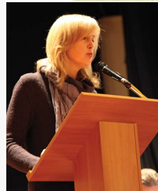
Выступление первого заместителя председателя Комитета по науке и высшей школе Санкт-Петербурга И.Ю. Ганус