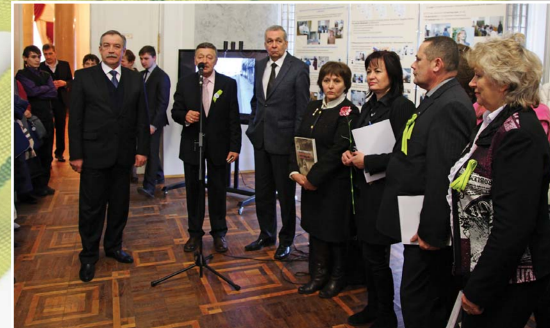
Открытие выставки «Герценовский рубеж стойкости: хроника блокадных дней»