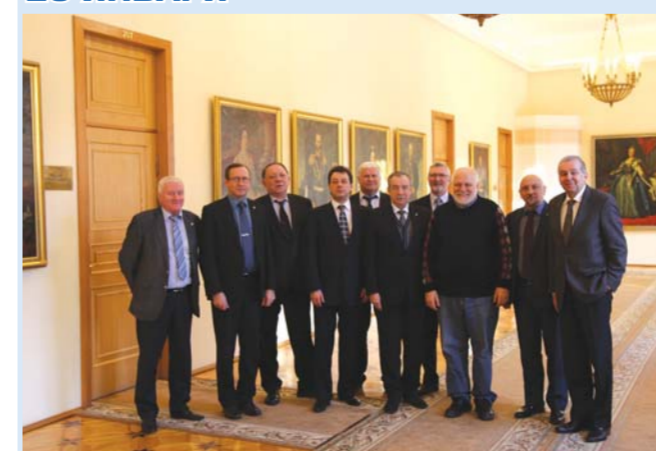
Визит в Герценовский университет ректора Московского педагогического государственного университета, академика РАН и РАО А.Л. Сенцова