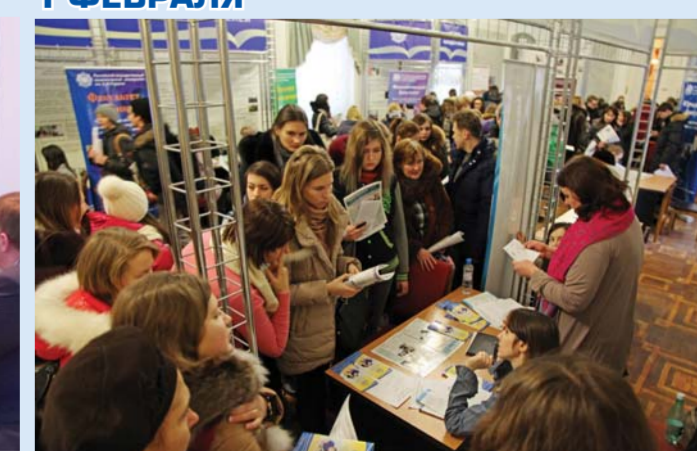
День открытых дверей