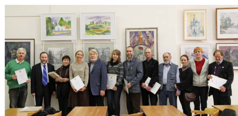
На открытии выставки «Татьянин день» в Герценовском университете