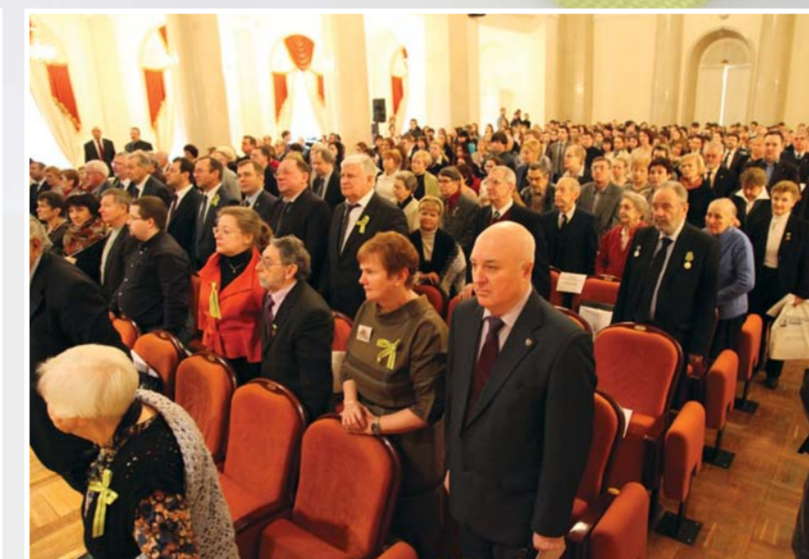
Всероссийская историко-культурная конференция «Блокада Ленинграда: история города в памяти поколений»