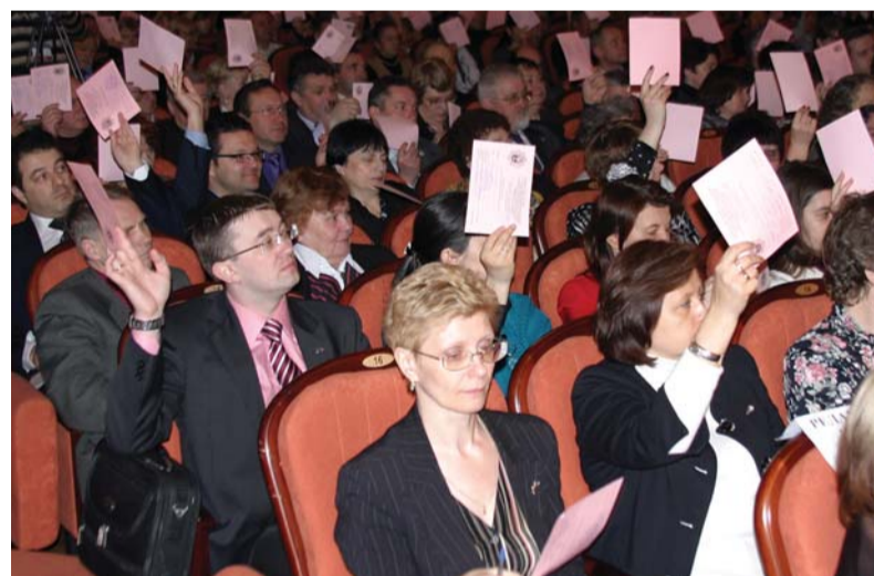
На конференции научно-педагогических работников, представителей других категорий работников и обучающихся РГПУ им. А.И. Герцена.