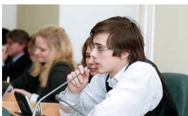
На встрече кандидатов на пост ректора с преподавателями, сотрудниками и студентами вуза.