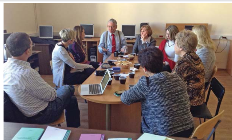
Рабочая встреча на кафедре информатизации образования

на английском языке. Преподаватели всех факультетов, принимавшие участие во встречах и семинарах, общались с коллегами на профессиональные темы без переводчиков. Студенты и магистранты понимали наших партнеров, многие из них задавали вопросы и включались в обсуждение проблем. Поскольку международный проект длится четыре года, в его деятельность смогут включиться и другие факультеты нашего университета. Это важно как с позиции освоения эффективных педагогических ИКТ инструментов, так и формирования межкультурных компетенции, решения профессиональных задач на английском языке в качестве средства межкультурного взаимодействия.