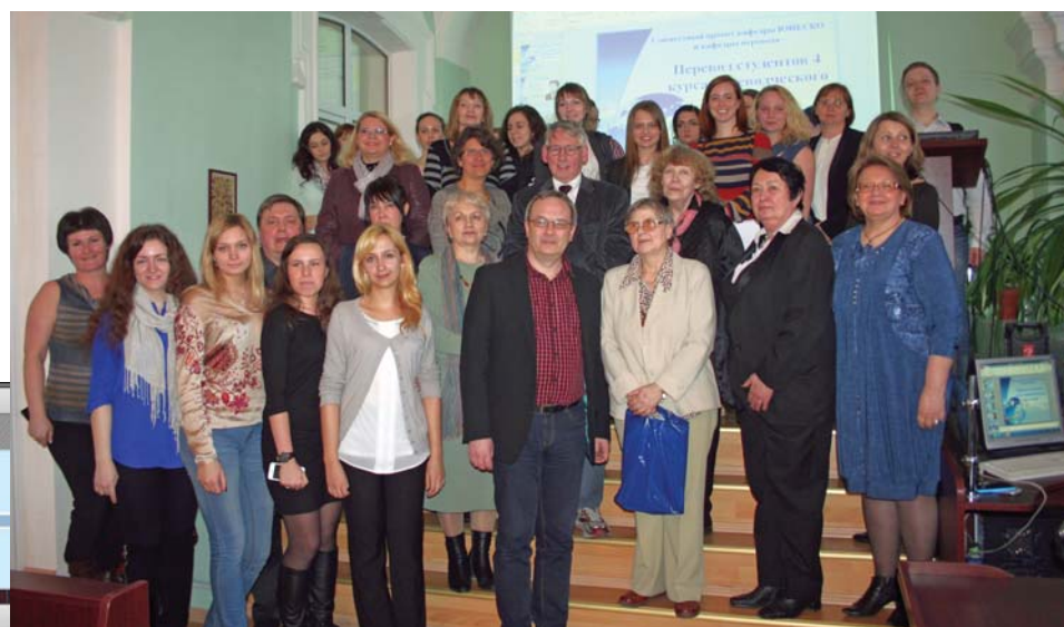
Семинар в библиотеке, организованный кафедрой Юнеско

С позиции формирования межкультурных компетенций значимой представляется вся коммуникация с зарубежными партнерами