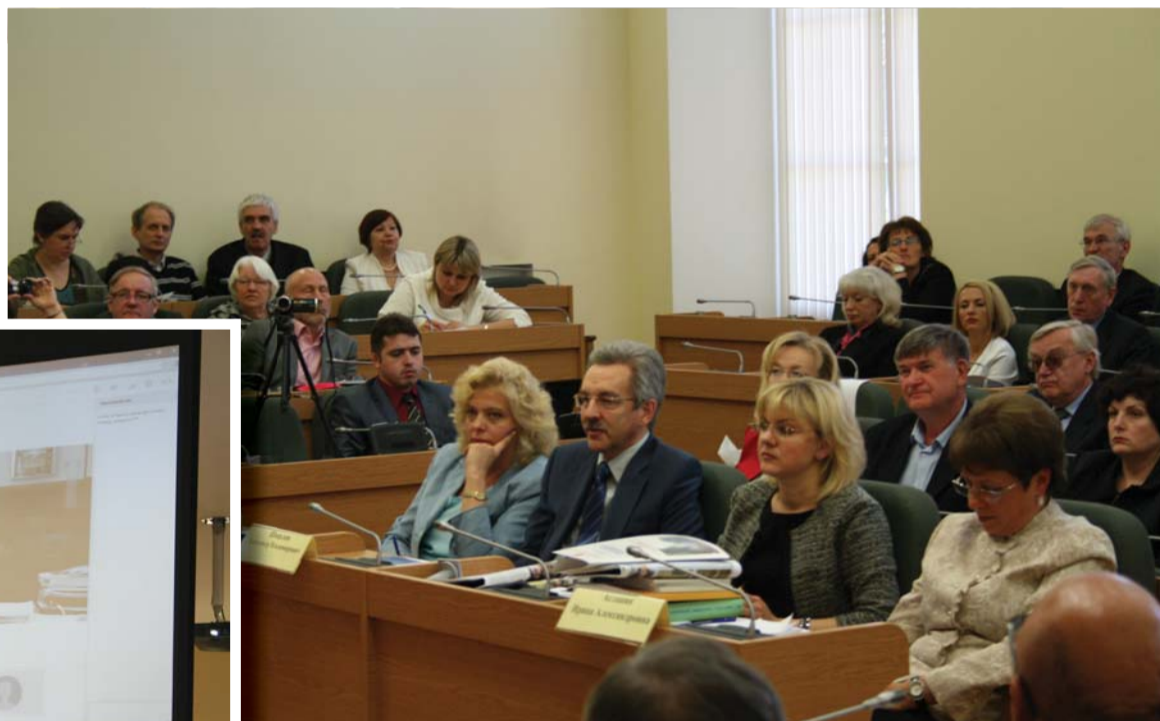
Уполномоченный по правам ребенка в Санкт-Петербурге С.Ю. Агапитова, Уполномоченный по правам человека в Санкт-Петербурге А.В. Шишлов, заместитель председателя Комитета по образованию Санкт-Петербурга И.А. Асланян (справа)