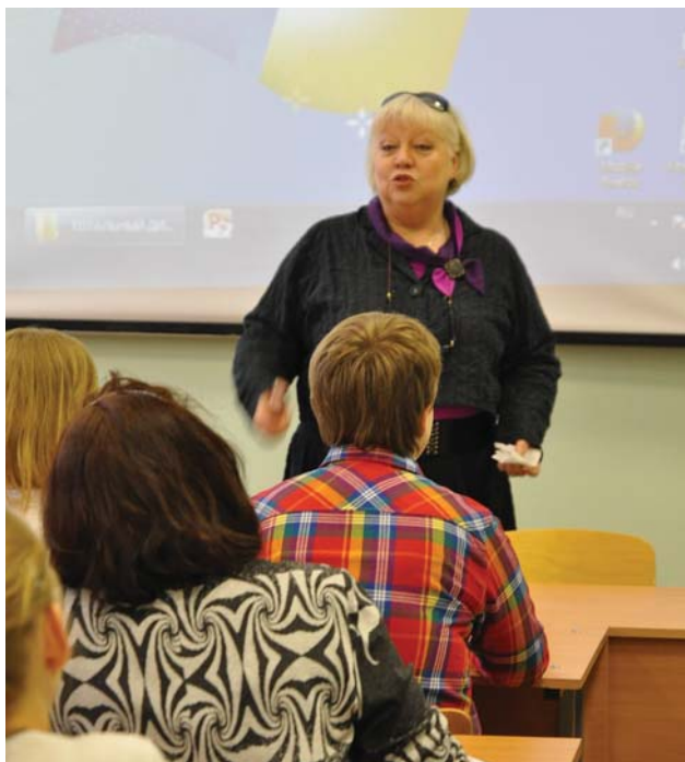
Актриса и режиссер Светлана Крючкова