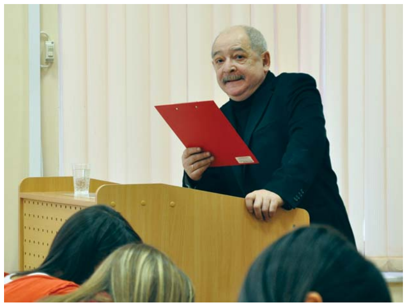
Историк и писатель Лев Лурье

12 апреля РГПУ им. А.И. Герцена стал одной из площадок «Тотального диктанта» – акции, завоевавшей популярность в России и за рубежом.