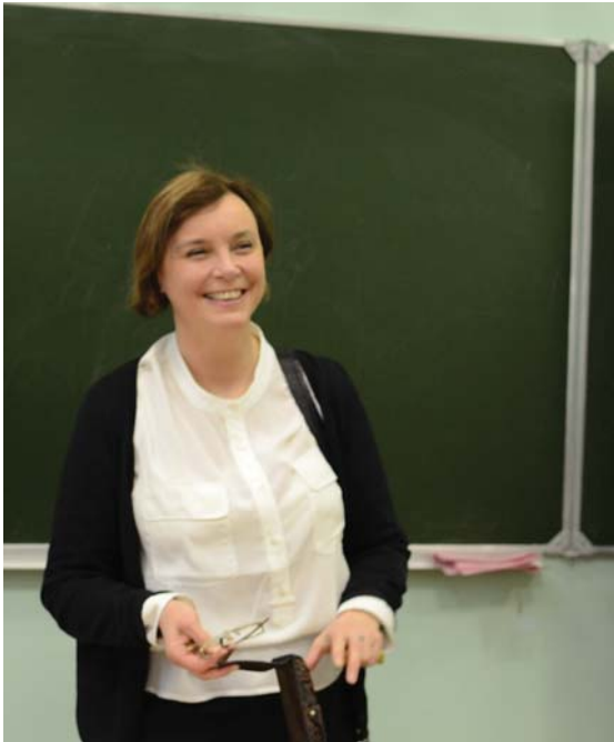
Актриса Мария Лаврова

ГЕРЦЕНОВСКИЙ УНИВЕРСИТЕТ СТАЛ ОДНОЙ ИЗ ПЛОЩАДОК ЕЖЕГОДНОЙ ОБРАЗОВАТЕЛЬНОЙ АКЦИИ «ТОТАЛЬНЫЙ ДИКТАНТ»