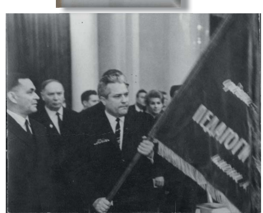
Награждение орденом Трудового Красного Знамени