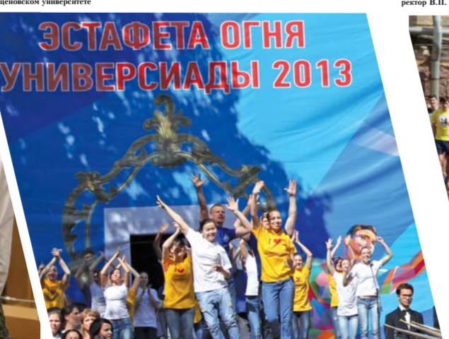
Стир в Герценовском университете петербургского этапа эстафеты огня Универсиады в Казани