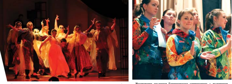
Дипломный спектакль студентов института музыки, театра и хореографии Герценовского университета