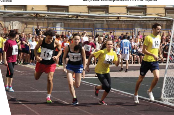
Весенний спортивный праздник «Герценовский колледж» на юни-стадионе РГПУ им. А.И. Герцена