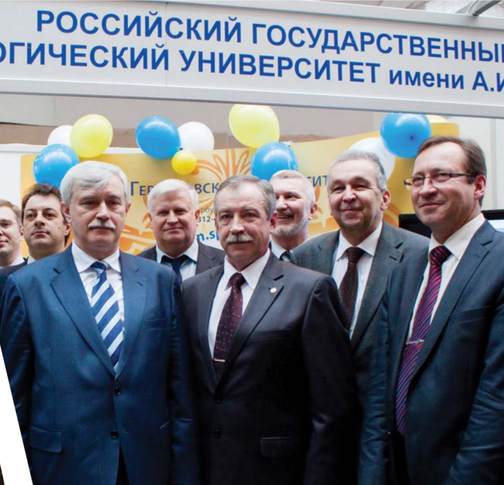
Губернатор Г.С. Полтавченко с делегацией Герценовского университета на выставке «Профессиональное образование Санкт-Петербурга»