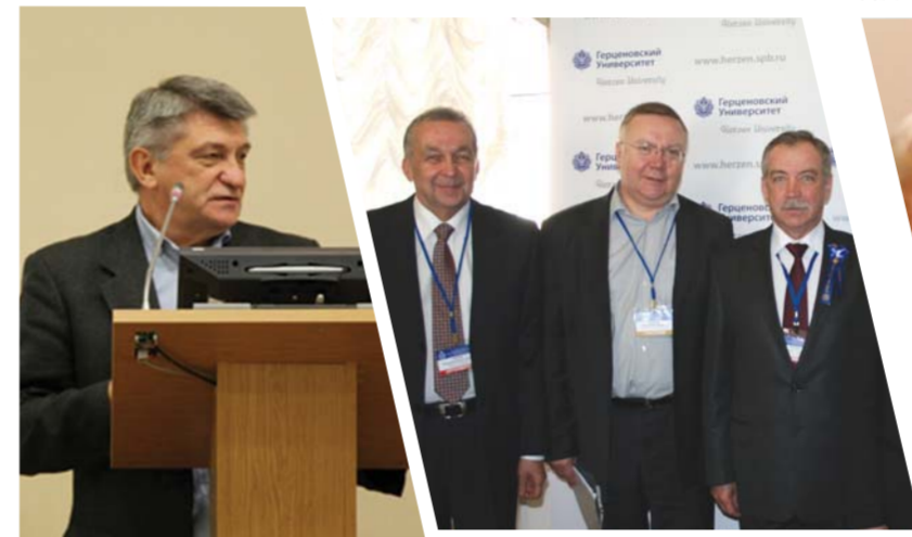
II Санкт-Петербургский международный культурный форум. Выступление режиссера, Народного артиста России А.И. Сокурова