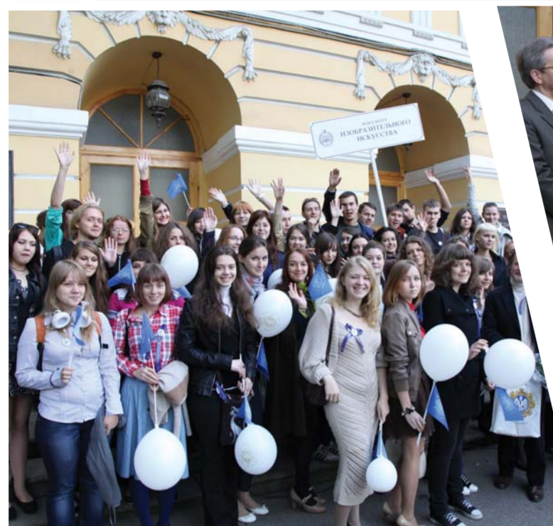
Первокурсники Герценовского университета в День знаний