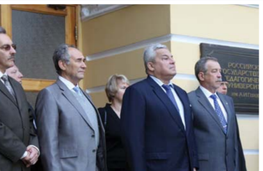
Вице-губернатор Санкт-Петербурга В.И. Кичада и Уполномоченный по правам человека в Санкт-Петербурге А.В. Швагин подводят итоги встречи Герценовского университета с Делегацией