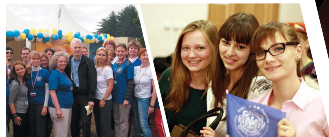
Советник Президента РФ А.А. Фурсов – специальный гость программы «Герценовский университет – шаг в будущее» на Всероссийской молодежной форуме «Скайтер»