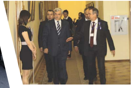
Губернатор Г.С. Полтавченко на лекции по Герценовскому университету