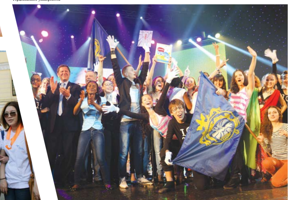
Финал фестиваля студенческого творчества «Я – молодежь!» на сцене «Мояш Халла». Студенты РГПУ им. А.И. Герцена – обладатели гран-при