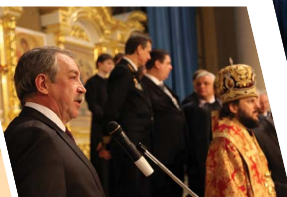
День российского студенчества. Модель в Соборном храме в кружевной шапке святой Таллы