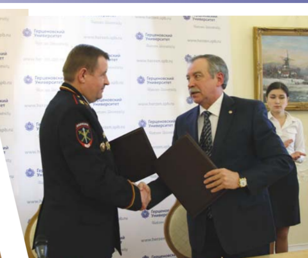
Подписание договора о сотрудничестве между ГУ МВД России по Санкт-Петербургу и Ленинградской области