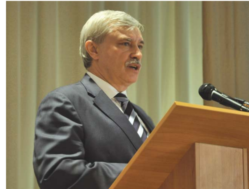
Губернатор Г.С. Полтавченко открывает II Всероссийскую педагогическую ассамблею и дает старт празднованию 215-летия РГПУ им. А.И. Герцена