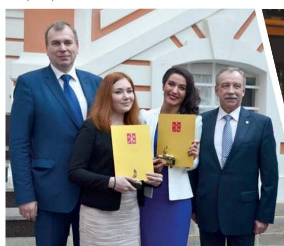
На церемонии чествования лучших студентов Санкт-Петербурга в Петропавловской крепости