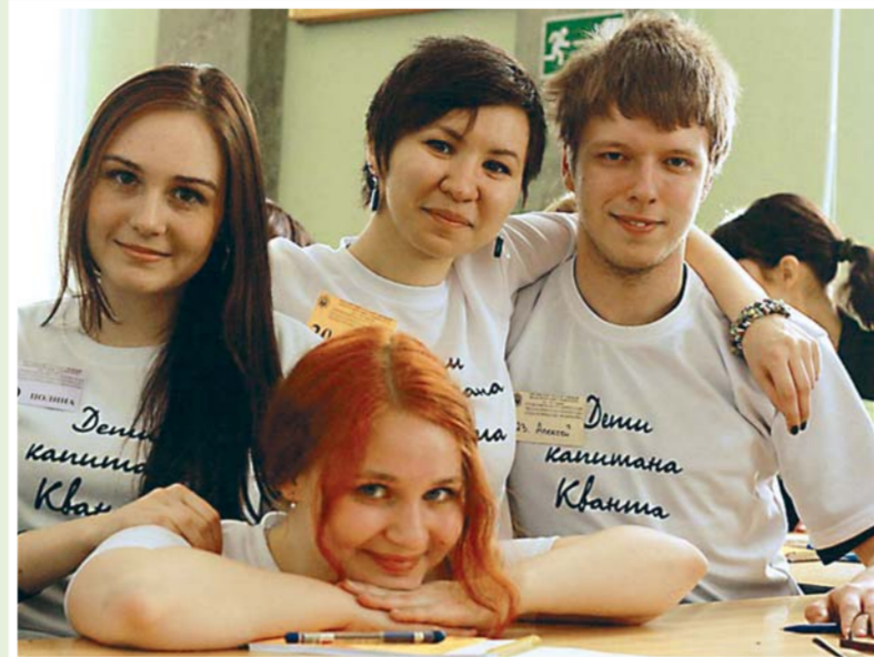
«Эврика: научный поиск», для аспирантов – «Научное творчество», для молодых учителей – «Профессиональные перспективы». «Первый успех» и «Профессиональные перспективы» проходят при поддержке Комитета по образованию Санкт-Петербурга. Их результаты позволяют учащимся пополнить свое портфолио, а учителям – пройти аттестацию.