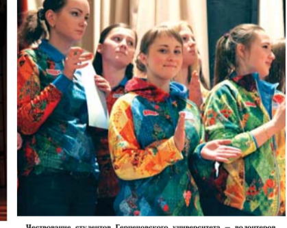
Чествование студентов Герценовского университета – волонтеров Олимпиады и Паралимпийской зимней игры в Сочи