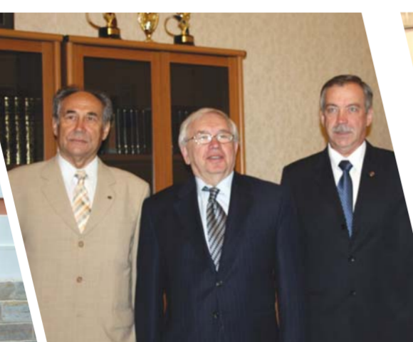
Общественный диалог, арт-проект Парламентского комитета России В.И. Лукин (в центре) в Герценовском университете