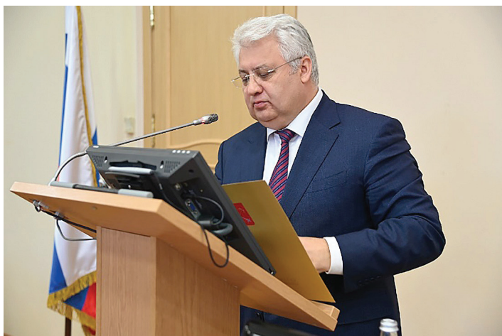
Зачитывается приветствие губернатора Санкт-Петербурга Беглова А.Д.

Форум проводился при поддержке Правительства Санкт-Петербурга в гибридном формате: пленарное заседание и секции в очном формате, на площадке РГПУ им. А.И. Герцена, онлайн-трансляция мероприятий Форума велась на платформе «VK Видео». Записи и представленные участниками из регионов видео-доклады, рабочие материалы были размещены на официальном сайте Университета в разделе: «Совместные проекты университета с Администрацией города».