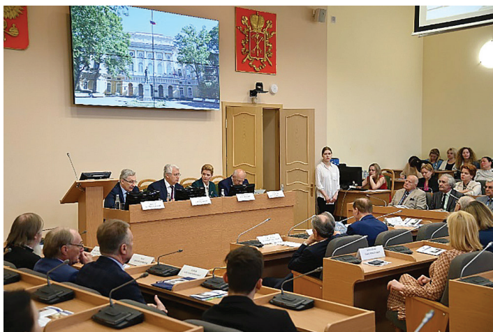
Торжественное открытие Форума: пленарное заседание ведет вице-губернатор Санкт-Петербурга проф. Эргашев О.Н.

17 мая 2023 года в Санкт-Петербурге была проведена очная часть III Санкт-Петербургского геронтологического Форума «Развитие российской геронтологии и приоритеты государственной политики в сфере медико-социальной помощи гражданам старшего поколения в России», инициированного Геронтологическим обществом при РАН, ставшего значимым событием в российской геронтологии.