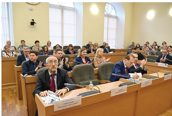
Участники пленарного заседания приветствуют подписание протокола о взаимодействии Правительства города с РГПУ им. А.И. Герцена

Активная деятельность Оргкомитета, 6 из 11 членов которого являются членами президиума ГО РАН, способствовала привлечению докладчиков из 24 регионов. Всего в программу Форума были включены 67 докладов, в том числе 38 очных и 29 в записи. Необходимо отметить, что из общего количества докладов 49 представили члены ГО РАН, что убедительно демонстрирует статус Форума, как одного из значимых ежегодных мероприятий Геронтологического общества.