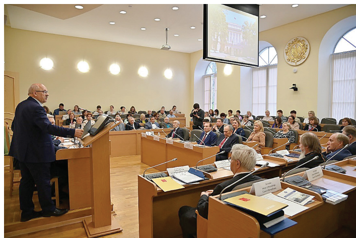
Приветствие председателя Законодательного Собрания Санкт-Петербурга Бельского А.Н. оглашает председатель постоянной комиссии по социальной политике и здравоохранению Ржаненков А.Н.