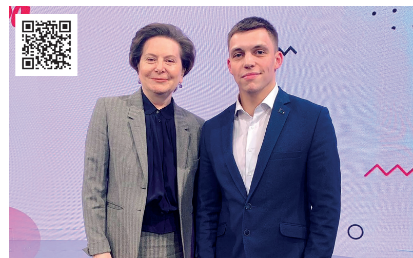
Губернатор Ханты-Мансийского автономного округа – Югры Наталья Комарова и Александр Старжинский после ток-шоу о молодежи «Твои Югры», декабрь 2019

И уже сегодня есть результаты. В первый же год моей работы были отпущены и отремонтированы участки внутрипоселковых дорог; наш поселок перешел на светодневное освещение – теперь и гулять вечером не страшно, и экономия ощутимая. Направили деньги на благоустройство, а округ выделил средства на евроконтейнеры для отходов, и теперь мусор не разлетается, а надежно лежит в контейнере под крышкой. Я взял под свой контроль и транспортировку твердых коммунальных отходов на специальный полигон в город Урай, а не на местную свалку. Так что то, о чем мечтал в детстве в плане улучшения качества жизни односельчан, осуществилось!