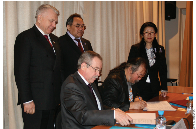
Первый заместитель председателя Комитета Совета Федерации ФС РФ по федеративному устройству, региональной политике, местному самоуправлению и делам Севера А.С. Матвеев; президент Ассоциации коренных малочисленных народов Севера, Сибири и Дальнего Востока РФ С.Н. Харючи; член Общественной палаты РФ, член рабочей группы ООН по правам человека, транснациональным корпорациям и иным видам бизнеса П.В. Суляндзига.

Международный фонд развития коренных малочисленных народов Севера, Сибири и Дальнего Востока РФ «Батани» был создан по инициативе руководства Ассоциации коренных малочисленных народов Севера, Сибири и Дальнего Востока РФ и датской организации TGK Consult в августе 2004 года для исполнения рекомендаций круглого стола «Проблемы развития коренных малочисленных народов и природные богатства российского Севера», прошедшего в рамках Петербургского международного экономического форума в июне 2004 года. Цель деятельности фонда – формирование имущества на основе добровольных взносов и иных законных поступлений для создания благоприятных условий жизнедеятельности коренных малочисленных народов Севера, Сибири и Дальнего Востока РФ.