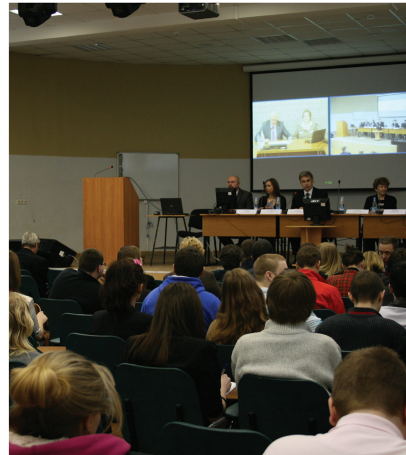
На открытии Школы здоровья

Общероссийская общественная организация «Лига здоровья нации» успешно сотрудничает с факультетом безопасности жизнедеятельности уже три года. Именно поэтому для поздравления факультета с 15-летием была выбрана столь необычная форма – научно-просветительское мероприятие.