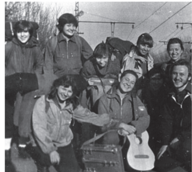
Роспись храма во имя Тихвинской иконы Божией Матери села Елга учащихся художественного отделения Бороничской школы искусств под руководством художника В.А. Куликова (выпуск 1995)