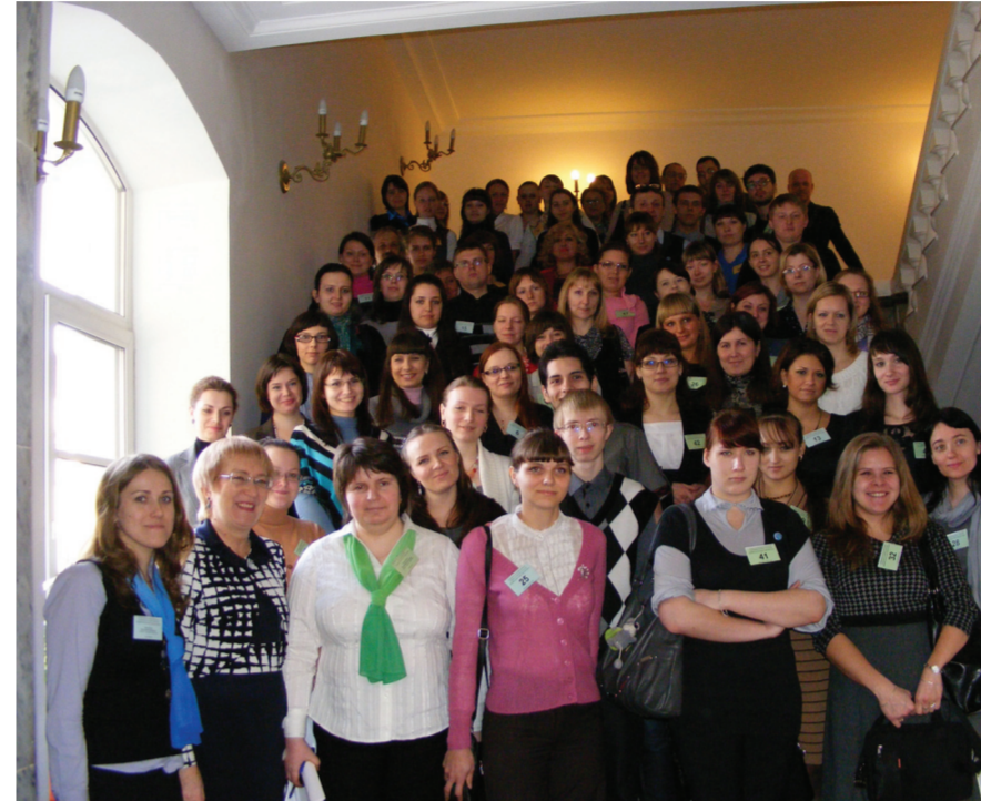
Участники и представители оргкомитета олимпиады

– Традиция Герценовской педагогической олимпиады родилась в 1970-е годы прошлого века, когда были проведены первые олимпиады для студентов, которые позже, в 1980-е, стали всеобщими. Для нашего университета, кафедры педагогики Герценовская педагогическая олимпиада сегодня – это большой научно-образовательный проект, представляющий пять ступенями. Наряду со студентами уже более десяти лет мы приглашаем старшеклассников,