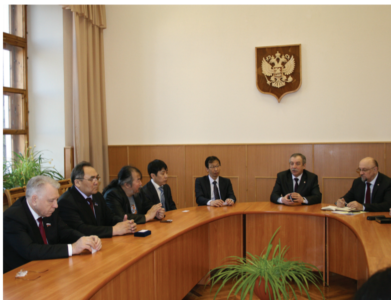
На встрече с ректором