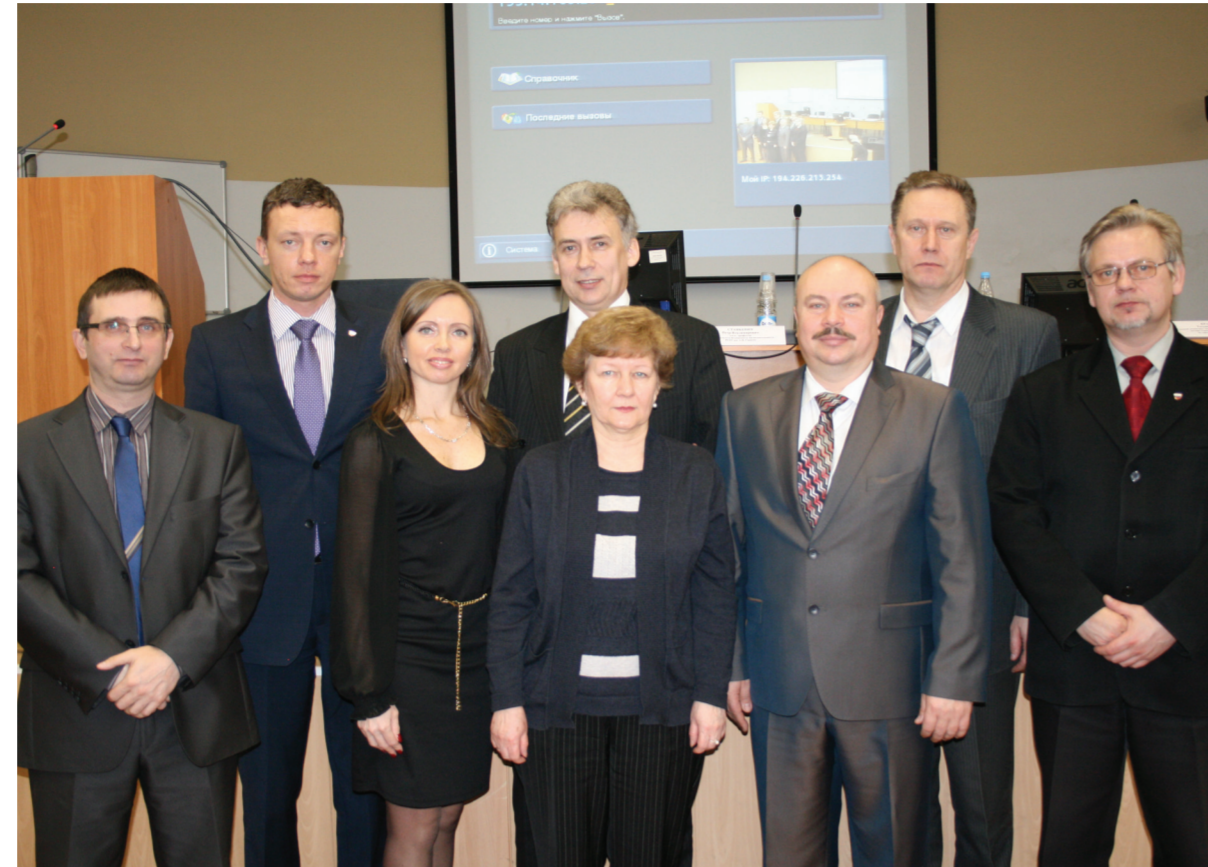
Общее фото на память