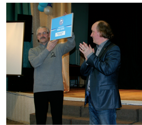
Вручение сертификата первого школьного фан-клуба ФК «Зенит»

Анастасия ПОСТНИКОВА, корреспондент «ПВ»