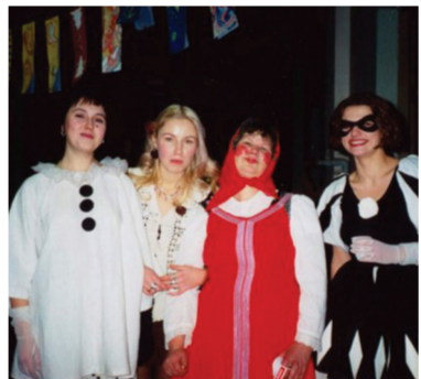
Поездка на этюды, 1985