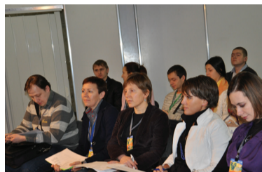
Работа в составе экспертной комиссии на презентации студенческих волонтерских проектов

Освоить за пять дней все премудрости и технические тонкости – задача непростая. Тем более что постепенно приходит понимание того, каким же должен быть сайт – не мертвым складом вопросов и заданий, а площадкой общения и дискуссии, форумом для реализации современного образовательного процесса.