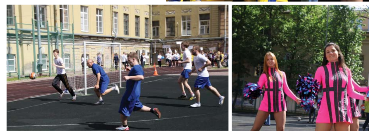
Товарищеский футбольный матч между командами администрации и студентов Герценовского университета. 3:0 победу одержали студенты.