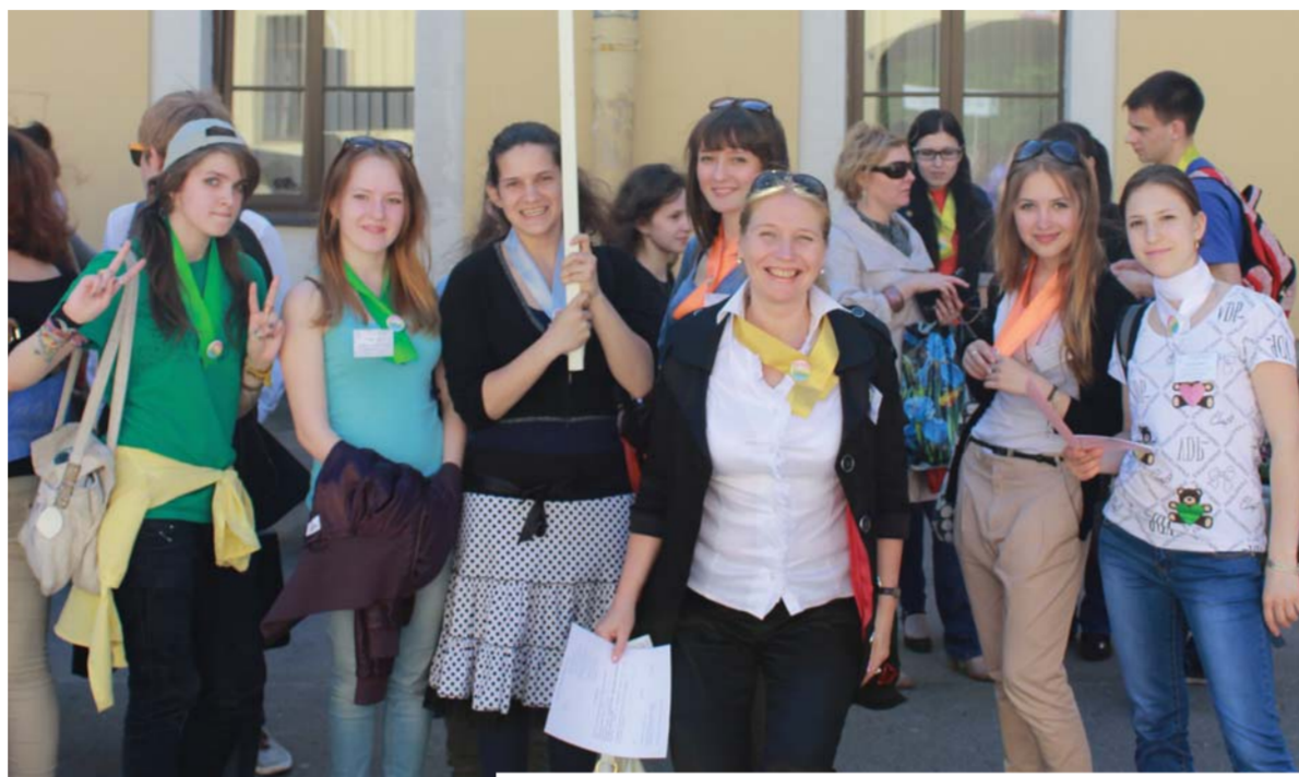
Студенты института детства на открытии форума «Моя инициатива в образовании»

что Россия – это не только Санкт-Петербург и Москва. Россия – это большая страна, с великим множеством разнообразных городов. И все они играют большую роль в жизни нашей Родины. Зная, что на форуме едут ребята из разных уголков России, мы решили дать возможность всем приезжим рассказать о своем городе, а местным студентам – получить эту полезную информацию и поделиться своей. Следует отметить, что площадка носила образовательный характер. Викторина «Этот город – самый известный город на Земле» прошла на «УРА!». Были задействованы все: и эксперты форума, и его участники. Это и было центральным звеном нашей программы, подготовленной для такого значитель-