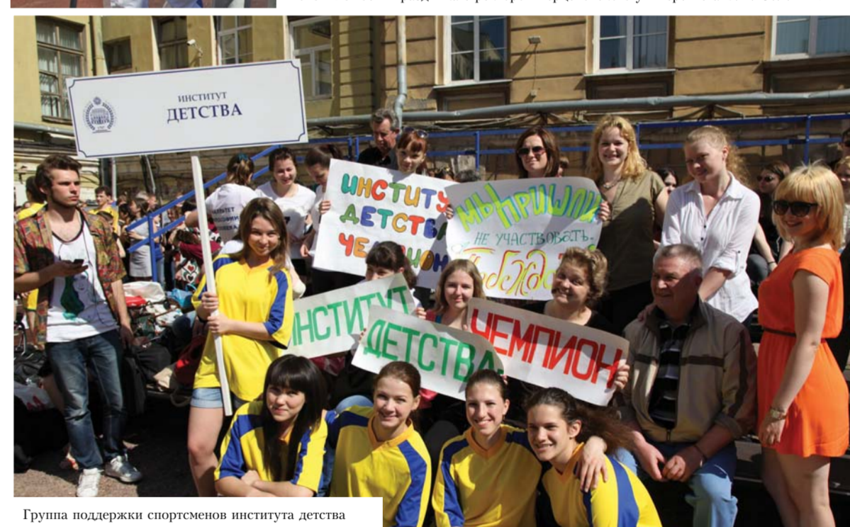
Группа поддержки спортсменов института детства