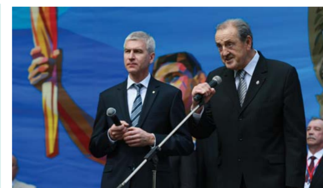
Президент Международной федерации студенческого спорта Клод Луи Гальен, президент Российского студенческого спортивного союза О.В. Матыцин

Президент Международной федерации студенческого спорта Клод Луи ГАЛЬЕН