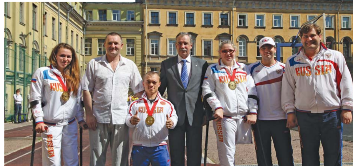
Почётные гости праздника с ректором Герценовского университета В.П. Соломиным