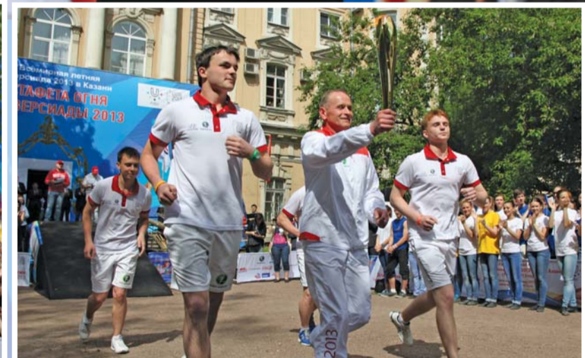
Трехкратный олимпийский чемпион, семикратный чемпион мира, заслуженный мастер спорта СССР по спортивной гимнастике, заведующий кафедрой гимнастики РГПУ им. А.И. Герцена А.Н. Дитятин с факелом Универсиады

Эти триста минут вписали Герценовский университет в историю мирового студенческого спорта и мирового спорта в целом. И здесь совпало все: богатые традиции подготовки спортсменов, сложившиеся в РГПУ им. А.И. Герцена, поколения российских учителей физкультуры, являющихся выпускниками Герценовского университета, эмоции наших студентов-паралимпийцев, только готовящихся сдать вторую в своей жизни экзаменационную сессию, и, конечно, планы организаторов сделать мероприятие как можно ярче и зрелищнее, подарить герценовцам, а также жителям и гостям