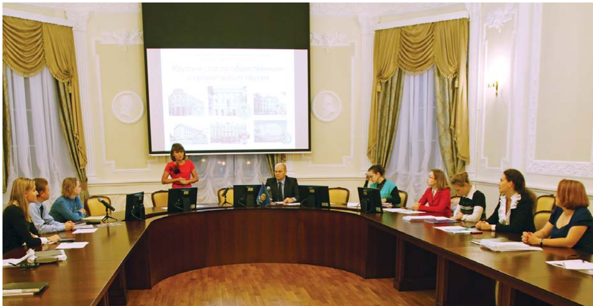
Круглый стол по общественным и гуманитарным наукам

КРУГЛЫЙ СТОЛ ПО ОБЩЕСТВЕННЫМ И ГУМАНИТАРНЫМ НАУКАМ В РАМКАХ XVIII САНКТ-ПЕТЕРБУРГСКОЙ АССАМБЛЕИ МОЛОДЫХ УЧЕНЫХ И СПЕЦИАЛИСТОВ САНКТ-ПЕТЕРБУРГА