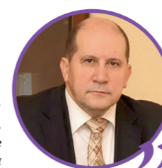
АЛЕКСЕЙ ДЕМИДОВ, председатель Совета ректоров вузов Санкт-Петербурга и Ленинградской области

Я от всего сердца поздравляю вас с этим замечательным днём, когда вы совершили решительный шаг в новую жизнь, и надеюсь, что он запомнится вам навсегда. Я хотела бы поздравить и ваших родителей, которые все эти годы волновались за вас, поддерживали и всячески помогали, создавая условия для вашей учёбы. Сегодня они горят за вами, понимая, что вы станете надёжной опорой для них.