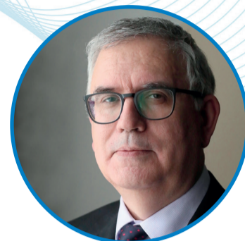
ВЛАДИМИР КНЯГИН, вице-губернатор Санкт-Петербурга

« Санкт-Петербург ждёт тех, кто хочет начать карьеру в наших школах. Также мы рассчитываем на то, что выпускники Герценовского университета, которые разъедутся по стране и миру, сохранят память о нашем замечательном городе и будут возвращаться сюда многократно, с благодарностью вспоминая свой родной вуз и своих наставников.