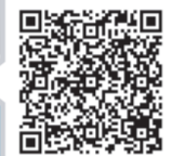
Сюжет телеканала «Санкт-Петербург»

В этом году выпускников Герценовского университета, окончивших обучение с отличием, в Колонном зале поздравили представители руководства Санкт-Петербурга и Ленинградской области и члены ректората РГПУ им. А. И. Герцена.