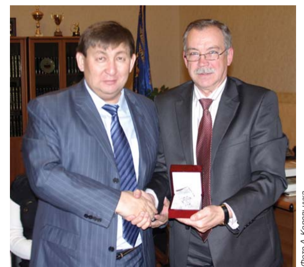
Обмен памятными подарками.