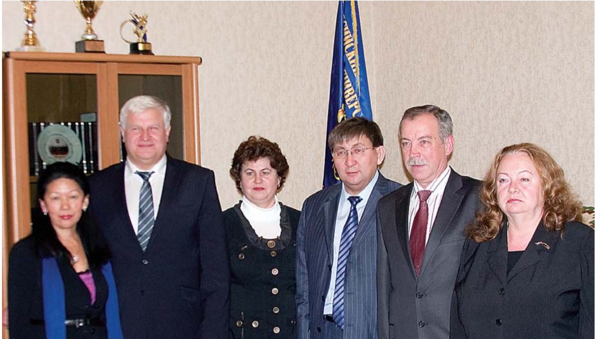
На приеме у ректора Герценовского университета.