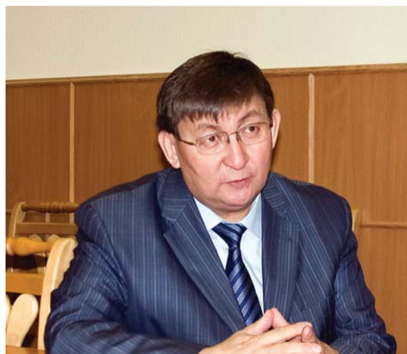
Министр профессионального образования, подготовки и расстановки кадров Республики Саха (Якутия), выпускник Герценовского университета Юрий Степанович Куприянов.